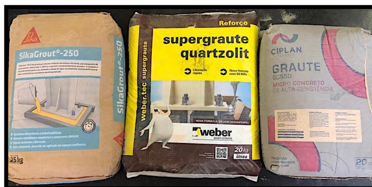
Figura 1 – Grautes Especiais (à esquerda SikaGrout 250®; ao centro Supergraute Quartzolit®; à direita Ciplan GC550®)

5 (cinco) minutos de mistura para padronização dos ensaios. Os produtos ensaiados estão representados na figura 1 abaixo.