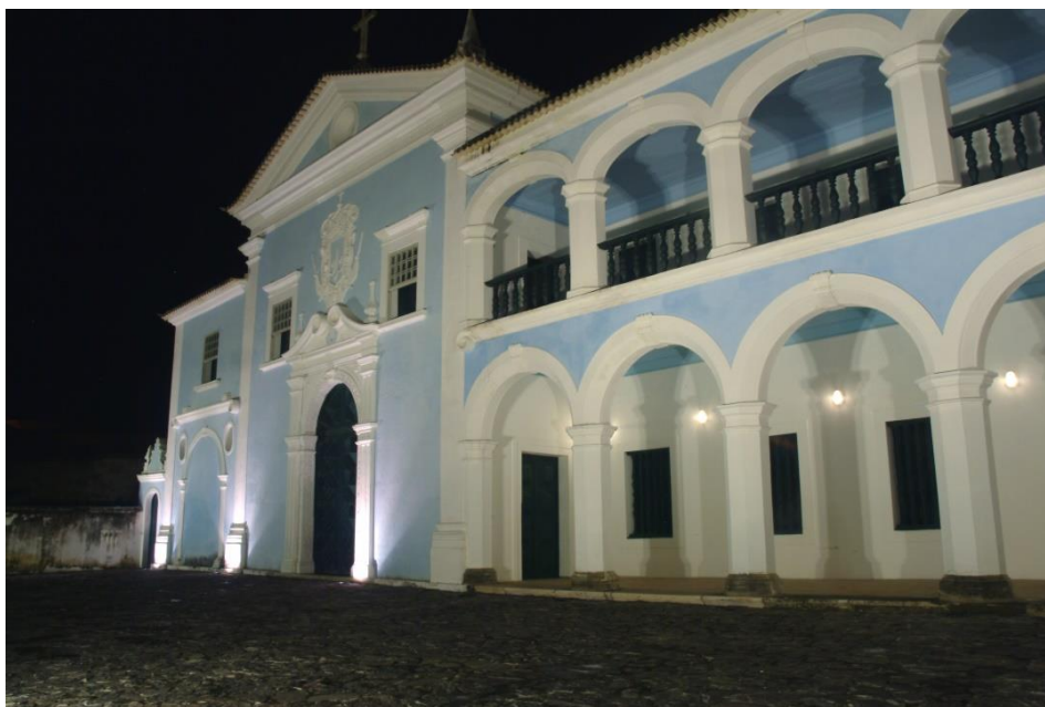
Figura 4 – Convento do Carmo antes da última restauração, na cidade de Cachoeira, Bahia