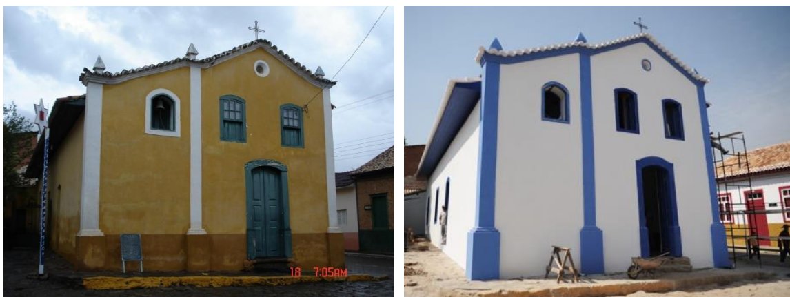
Figura 7 – (a) – Capela das Mercês, em São Luiz do Paraitinga, São Paulo, antes da enchente. (b) Capela das Mercês, em São Luiz do Paraitinga, São Paulo, depois da reconstrução