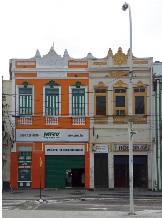
Figura 3 – Edificação histórica em Campos dos Goytacazes

edificação em questão impactou profundamente na visualização da forma do edifício (Figura 3). Este exemplo possibilita visualizar as questões discutidas sobre a Teoria da Gestalt, acerca da impossibilidade de dissociação entre forma e cor e nele é possível perceber que as composições cromáticas extemporâneas ao período de construção do edifício conduzem a uma nova imagem da arquitetura.