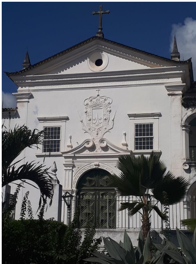
Figura 6 – Convento do Carmo, em Cachoeira, Bahia, após a última restauração