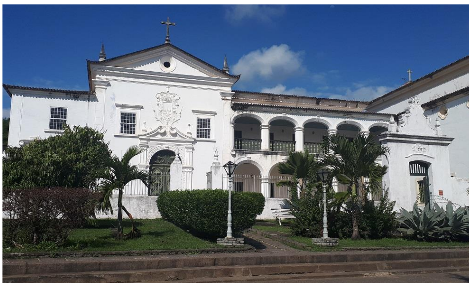
Figura 5 – Convento do Carmo, em Cachoeira, Bahia, após a última restauração