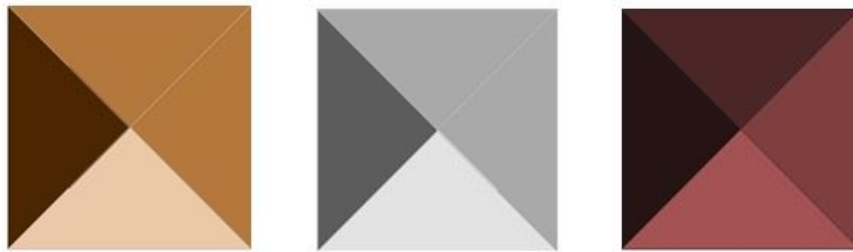
Figura 1 – Painéis geométricos criados para relacionar cores e ilusão ótica